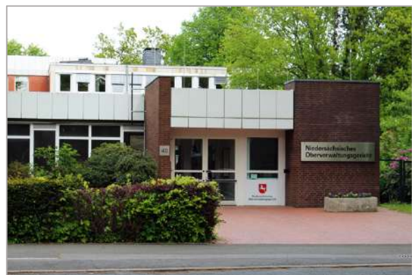
Das Niedersächsische Oberverwaltungsgericht in Lüneburg

Drehen wir nun dem Backsteingebäude, den Buchsbäumen und Blumen im Vorgarten des Oberverwaltungsgerichts den Rücken zu, überqueren die Straße, gehen einige Schritte nach links und begeben uns in den Kurpark. Wir halten uns rechts und durchlaufen den Kurpark in Richtung Norden. Der Weg entlang baumgesäumter