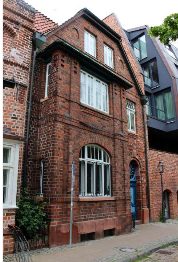
Niklas Luhmanns Geburtshaus in der Salzstraße Am Wasser

Das Gebäude aus dem 16. Jahrhundert beeindruckt mit seinen braunen Backsteinen und ist mittlerweile seit fünf Generationen im Besitz der Familie Luhmann. Besonders auffällig ist die aufwendig gestaltete, blaue Holztür, die in einem runden Türbogen eingelassen wurde. Von dort sind es nur ein paar Schritte zum Wasser der Ilmenau und zur wohl beliebtesten Lüneburger Fotokulisse auf der Lüner Brücke, auf der sich vor allem im Sommer Anwohner und Besucher gleichermaßen tummeln. Die Aussicht auf den Kran, die historischen Gebäude und alten Salzboote dienen mit ihrer Schönheit heute als Postkartenmotiv der Stadt Lüneburg. Während Luhmanns Kindheit waren sehr viele Geschäftsleute im Wasserviertel unterwegs, die Handel über den Hafen trieben. Die Lüner Brücke stellte dabei die Verbindung zwischen dem Hafen und der Altstadt Lüneburgs dar, weshalb sie auch heute noch als Tor zur Altstadt bezeichnet wird.