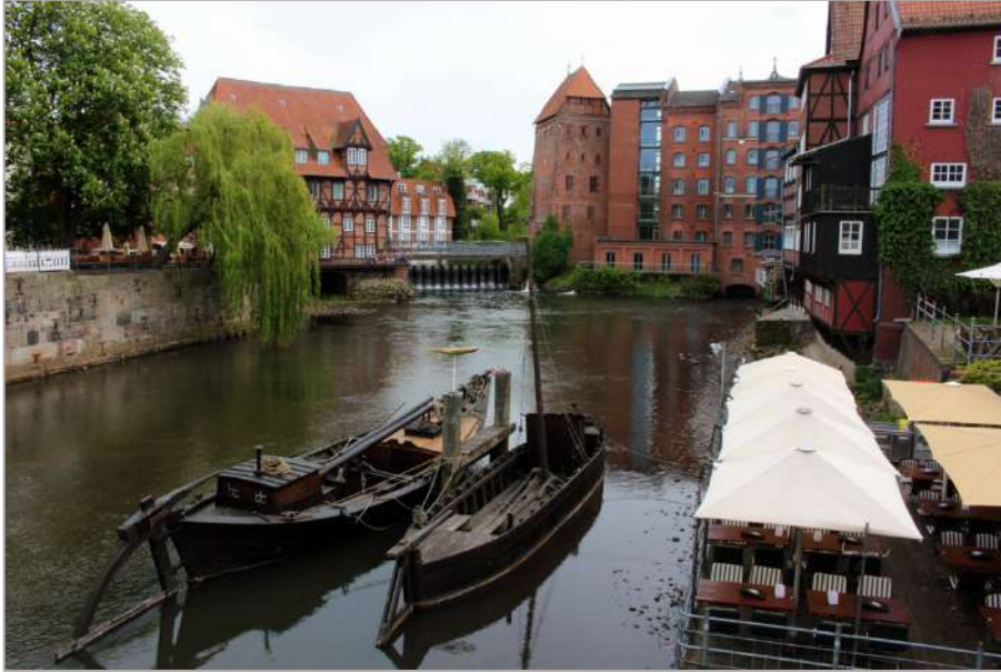
Das historische Wasserviertel Lüneburgs

Heute gilt er als der bekannteste deutschsprachige Soziologe und Vertreter der Systemtheorie, eine der letzten Universaltheorien. Die Systemtheorie begreift Gesellschaft als ein auf Kommunikation basierendes System, das ermöglicht, sämtliche Bereiche der modernen Gesellschaft zu beschreiben und in ihrer Struktur zu verstehen. Dabei gliedert er das Gesellschaftssystem in verschiedene Teilsysteme und unterscheidet zwischen psychischen und sozialen Systemen. Luhmann geht davon aus, dass jedes gesellschaftliche System eine Struktur beinhaltet, die sich auch in allen anderen Systemen, wie beispielsweise der Familie, Bildung oder Massenmedien, wiederfinden lässt. Er ist dabei von der Frage motiviert, wie sich die Ordnung der komplexen und unüberschaubaren Gesellschaft der Moderne erklären lässt. Inspirieren ließ er sich unter anderem von der Systemtheorie des amerikanischen Soziologen Talcott Parsons, der die Gesellschaft bereits als ein komplexes Gefüge zwischenmenschlicher Kommunikation untersucht hat. Parsons gilt als einer der einflussreichsten soziologischen Theoretiker nach dem Zweiten Weltkrieg. Außerdem setzte sich Niklas Luhmann mit dem Philosophen und Soziologen Jürgen Habermas auseinander, zu dem er eine freundschaftliche Rivalität mit ständigen Seitenhieben pflegte.