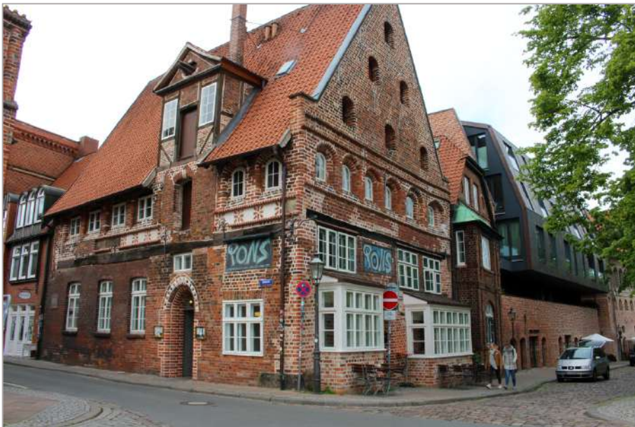
Die Gaststätte „Pons“ in der Salzstraße Am Wasser

Am Ende des Kurparks biegen wir nach rechts und erreichen eine weitere Ampelkreuzung. An dieser gehen wir nach links und folgen der Sülztorstraße weiter in Richtung Norden bis zum Lambertiplatz. Diesen überqueren wir und biegen nach rechts in die Heiligengeiststraße. Wir folgen ihr, bis wir den Platz „Am Sande“ erreichen, einer der zentralen Plätze der Stadt Lüneburg. Am anderen Ende des Platzes ragt die St. Johanniskirche, die wir auf unserem Weg zur Oberschule am Wasserturm bereits passiert haben, in den Himmel. Nun biegen wir allerdings nach links in die Kleine Bäckerstraße, folgen dieser bis sie in die Große Bäckerstraße übergeht und laufen am Marktplatz entlang, einer der weiteren zentralen Plätze im Stadtzentrum Lüneburgs. Wir gehen weiter geradeaus, folgen der Großen Bäckerstraße, die in die Bardowicker Straße mündet und biegen in die nächste Straße, die Lüner Straße, nach rechts ein, bis wir wieder zur Gaststätte Pons gelangen. Am Ende der Lüner Straße befinden wir uns nun genau dort, wo auch Luhmanns Zeit in Lüneburg ihren Anfang und ihr Ende hatte.