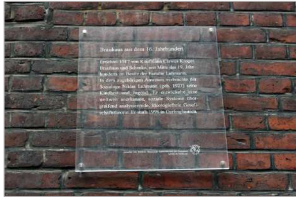
Altes Brauereischild und Gedenktafel in der Lüner Straße

Drehen wir uns nun einmal um 180 Grad in Richtung Lüner Brücke und biegen davor nach rechts in die Straße „Am Stintmarkt“ ein. Wir folgen der Straße bis zum Ende und halten uns auf der linken Seite, bis wir die Ilmenaustraße erreichen. Dann gehen wir entlang der Ilmenau in Richtung Süden bis zur Altenbrückertorstraße. Schließlich biegen wir rechts ab, laufen entlang der St. Johanniskirche und biegen wieder nach links in die Kalandstraße ein.