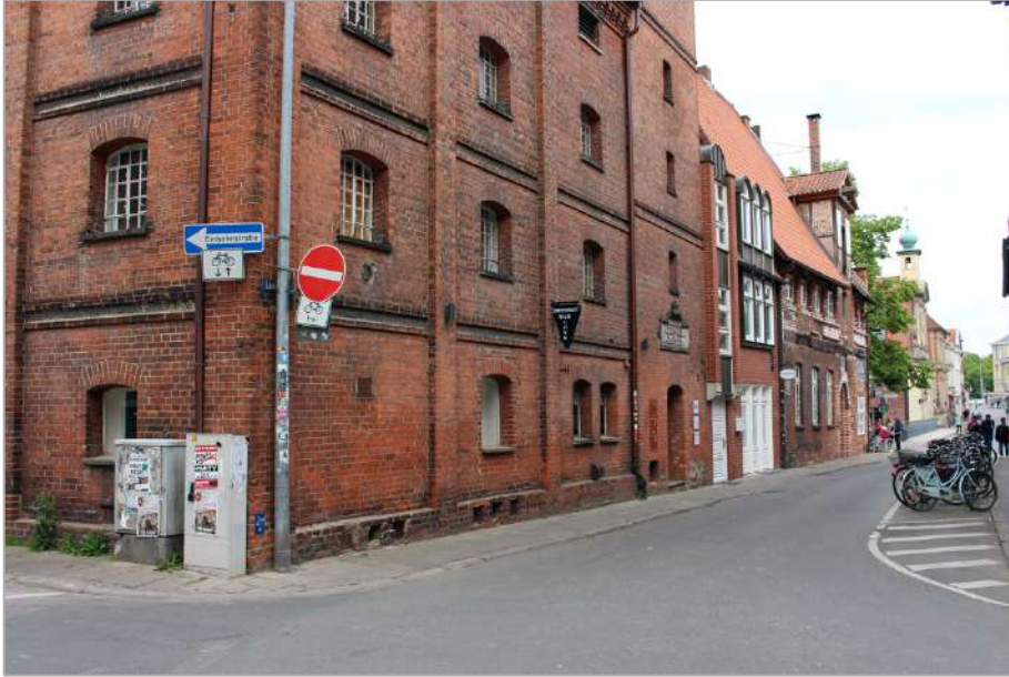
Die ehemalige Brauerei der Familie Luhmann