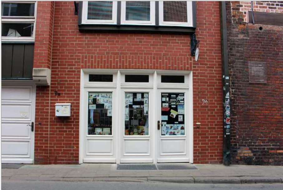
Dieter Luhmanns Antiquariat „Pliniana“

seinem Tod lehrte er an der Universität in Bielefeld. Luhmanns Systemtheorie allerdings lebt weiter – aus vielen Fachrichtungen und in der gesellschaftlichen Praxis ist sie heute nicht mehr wegzudenken.