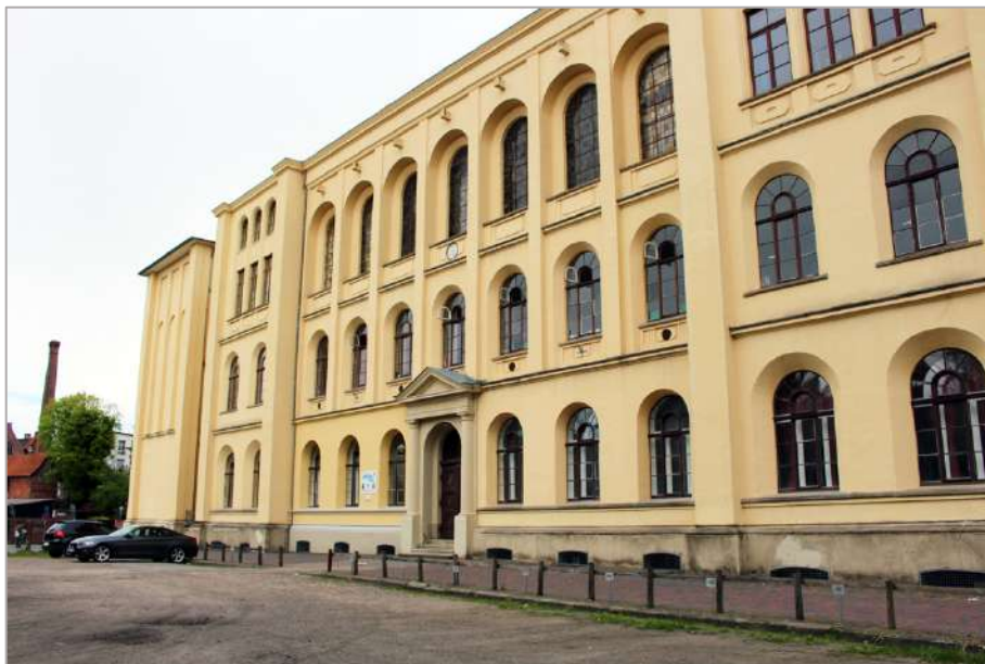
Die unter Denkmalschutz stehende Oberschule am Wasserturm

Das sonnengelbe Gebäude auf unserer linken Seite ist heute die Oberschule am Wasserturm, eine Ganztagsoberschule. Zu Zeiten von Luhmanns Kindheit war hier das Johanneum, das traditionsreichste Gymnasium der Stadt Lüneburg und eine der ältesten Schulen im deutschsprachigen Raum. Direkt am Clamartpark und Wasserturm ging Niklas Luhmann zur Schule. Nachdem er die vierte Klasse übersprungen hat, wechselte er schon mit neun Jahren auf das Johanneum und war damit der Jüngste in seiner Klasse. Durch die liberale Erziehung seiner Eltern war er Institutionen gegenüber skeptisch und ging nicht gerne zur Schule.