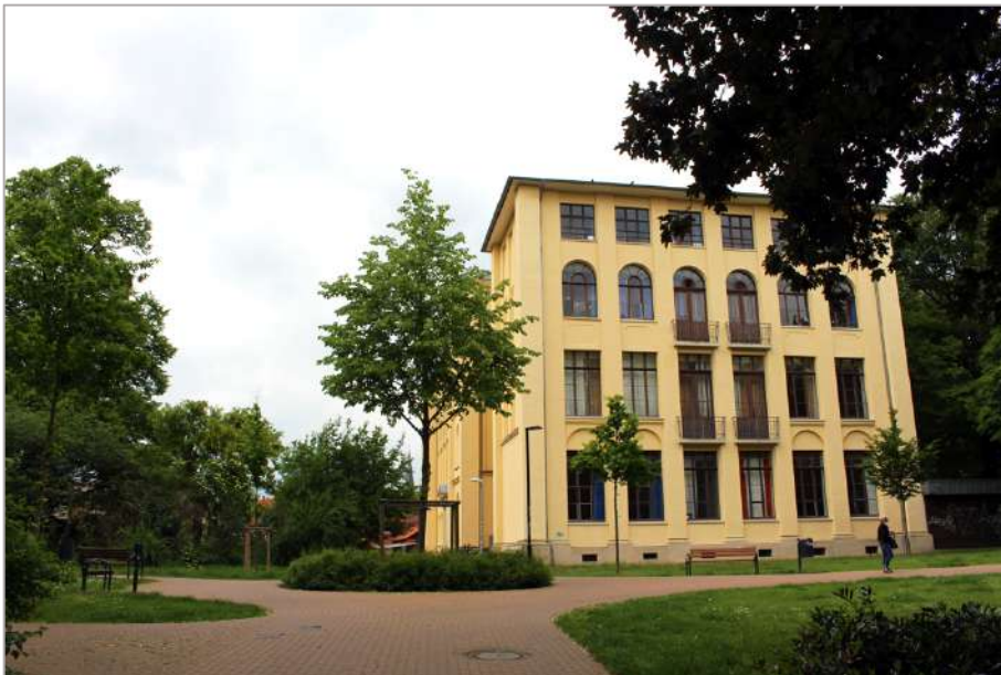
Das Gebäude der heutigen Oberschule am Wasserturm wurde 1872 erbaut

Als Niklas Luhmann mit nur 15 Jahren gemustert und für tauglich befunden wurde, wurde der Krieg schließlich zum Alltag für ihn. Jeden Vormittag musste er drei Stunden zur Kriegsvorbereitung, bis seine Klasse schließlich in die vormilitärische Ausbildung entlassen und er zwei Jahre später an die Front einberufen wurde. Als Luftwaffenhelfer war er auf Flugplätzen in Lüneburg, Stade und Rotenburg im Einsatz. 1945 landete Luhmann in der amerikanischen Kriegsgefangenschaft, wurde jedoch wegen Minderjährigkeit vorzeitig entlassen und kehrte 1945 zurück zum Johanneum. Dort belegte er einen Übergangskurs, um die Hochschulreife zu erlangen und studieren zu können. Ein Jahr später schloss er diesen erfolgreich ab und verließ Lüneburg, um Rechtswissenschaften an der Albert-Ludwigs-Universität in Freiburg zu studieren. Er sah die Wissenschaft als Möglichkeit, sich frei von politischer Einflussnahme und Ideologie bewegen zu können.